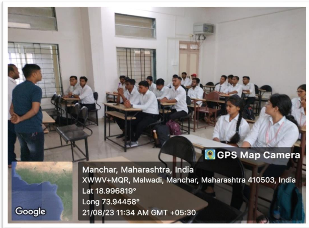
Insightful Java Session led by Industry Experts.