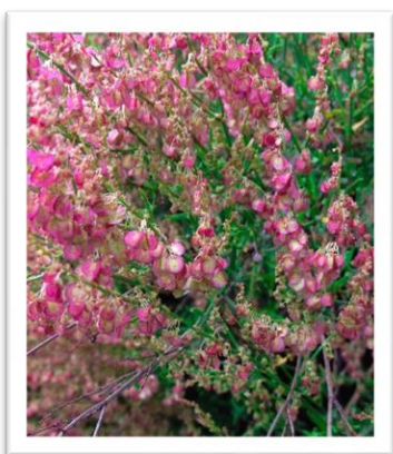
Cover Page Photograph by: JAYESH SHETE, BE CIVIL 24